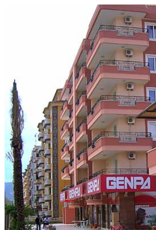
På første parallel vej ses den bagerste ejendom hvor der er flyttet et stort supermarked ind: GENPA