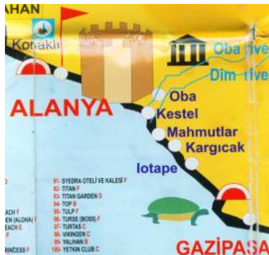
På det lille turistkort kan ses - at udad kystvejen ligger Mahmutlar ca. 12 km fra Alanya.