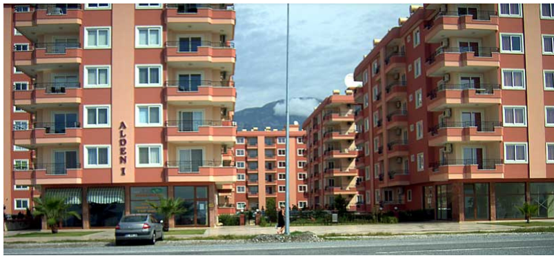
De 5 "lyserøde" bygninger set fra stranden - lejligheden er placeret i den anden bygning - højre side "bagerst" - 5' sal.